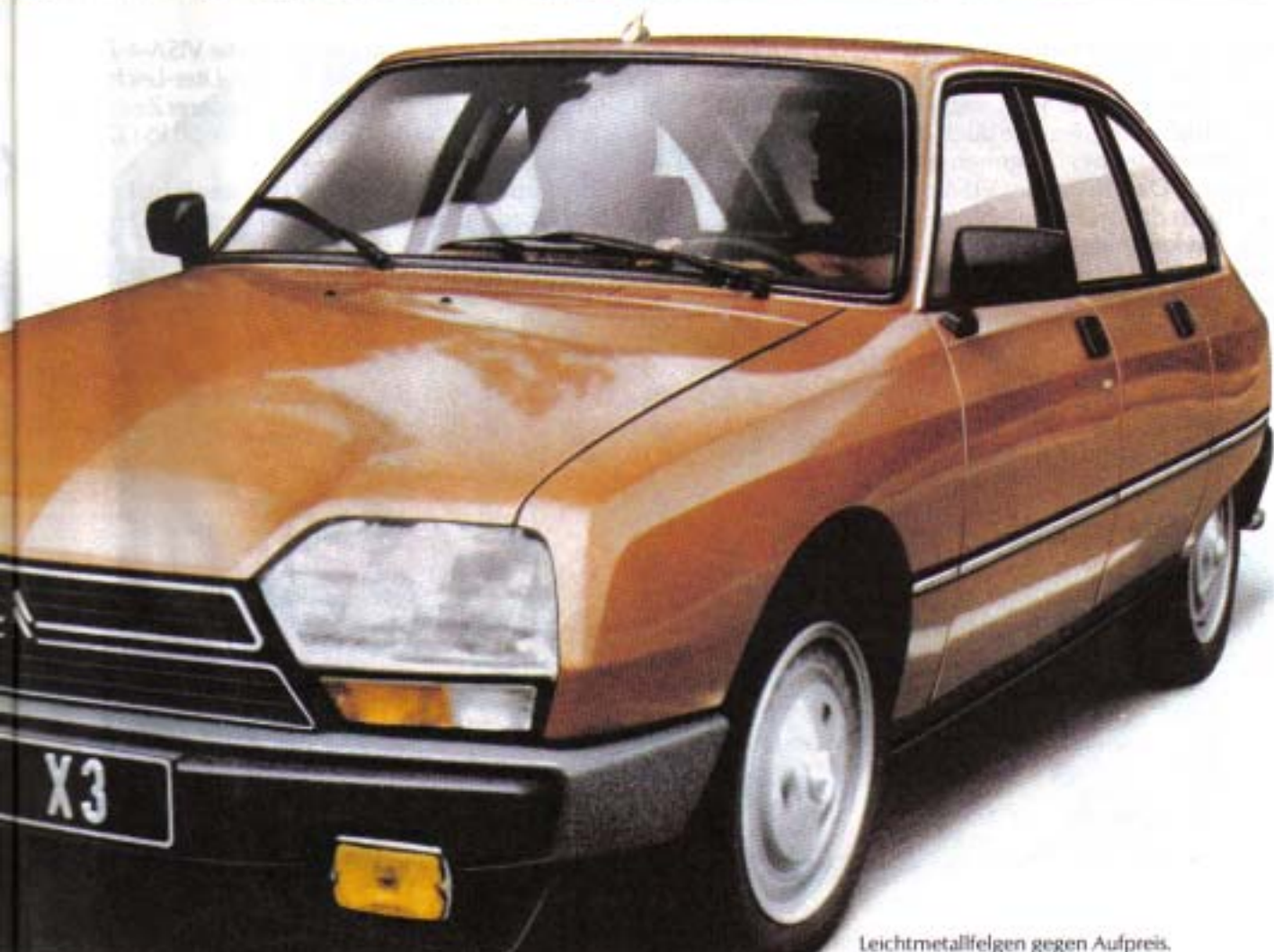
Leichtmetallfelgen gegen Aufpreis.